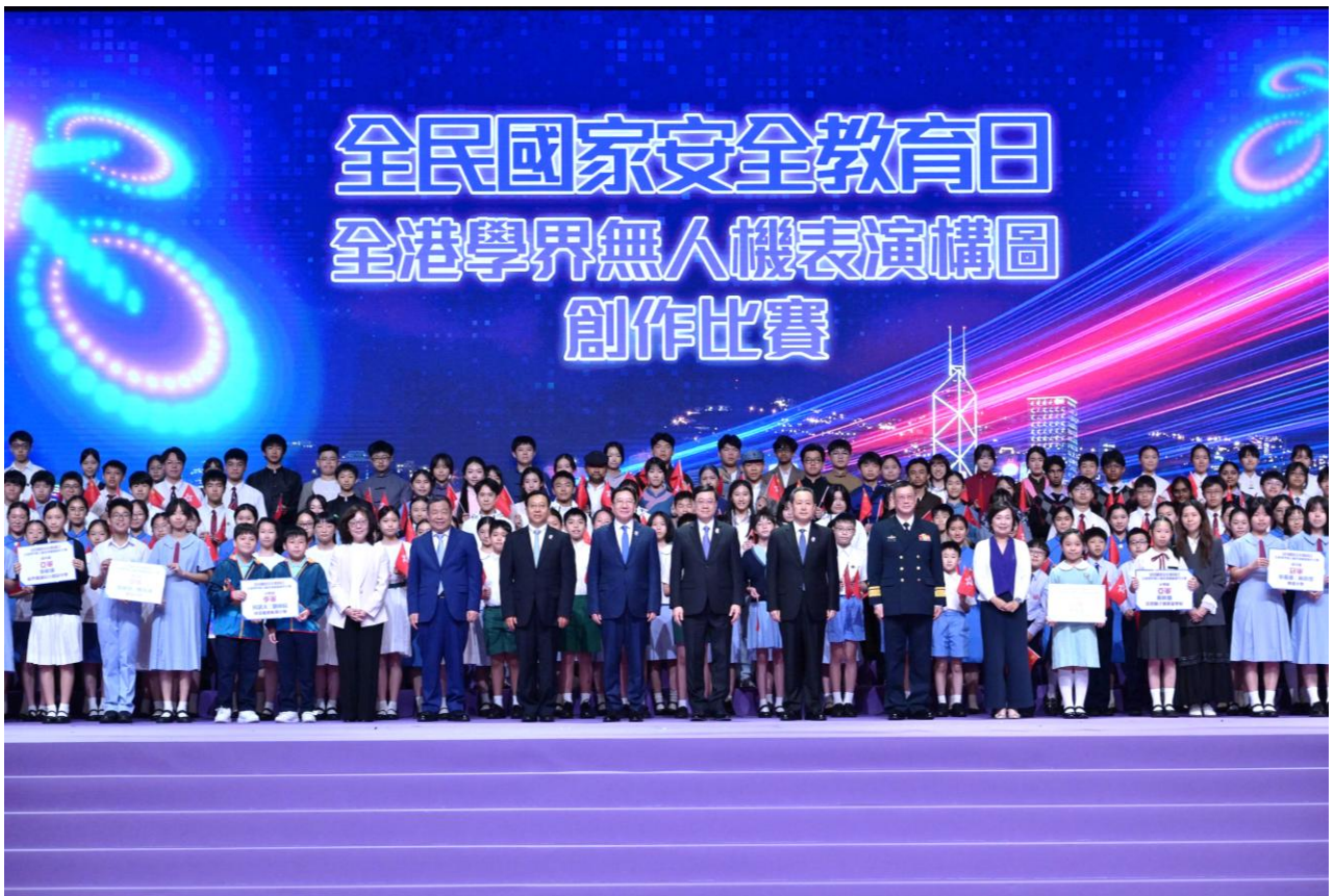
行政長官李家超先生(首排右九)出席全民國家安全教育日：全港學界無人機表演構圖創作比賽頒獎典禮，與本校得獎生 2D 李梓瑛同學（首排左一）及一眾嘉賓合照