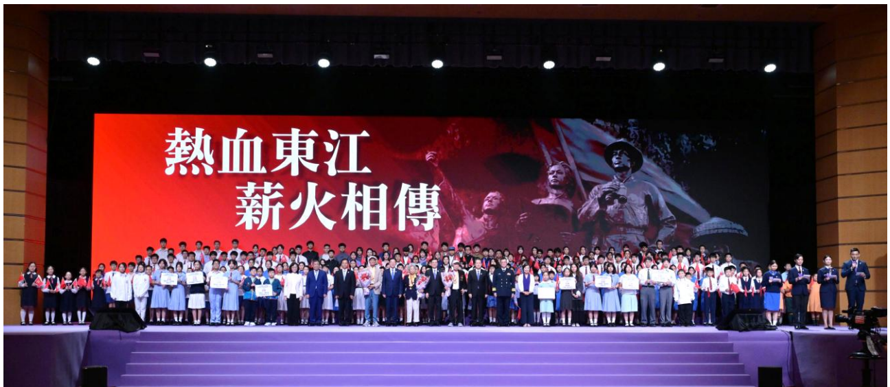
行政長官李家超先生(前排右九)出席全民國家安全教育日開幕典禮，與本校得獎生 2D 李梓瑛同學（前排左十）及一眾嘉賓合照