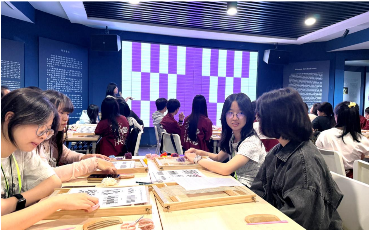
同學親身參與非物質文化遺產蜀錦製作的體驗活動