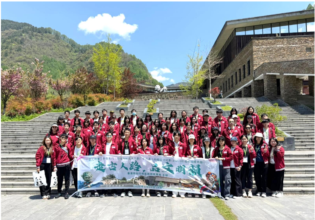
同學在臥龍中華大熊貓苑神樹坪基地合影