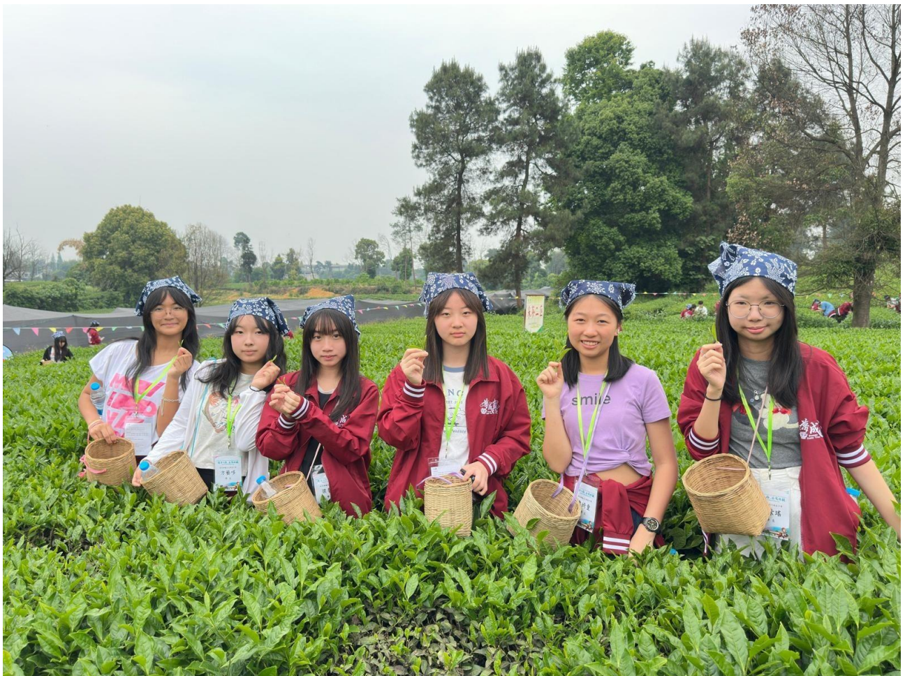
同學在石象湖國際研學營地體驗採集茶葉的工作