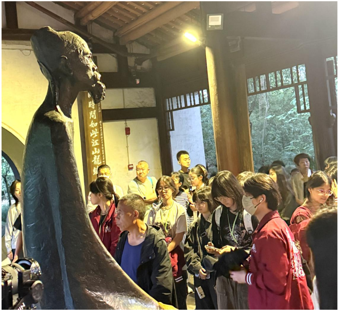
同學在杜甫草堂內參觀