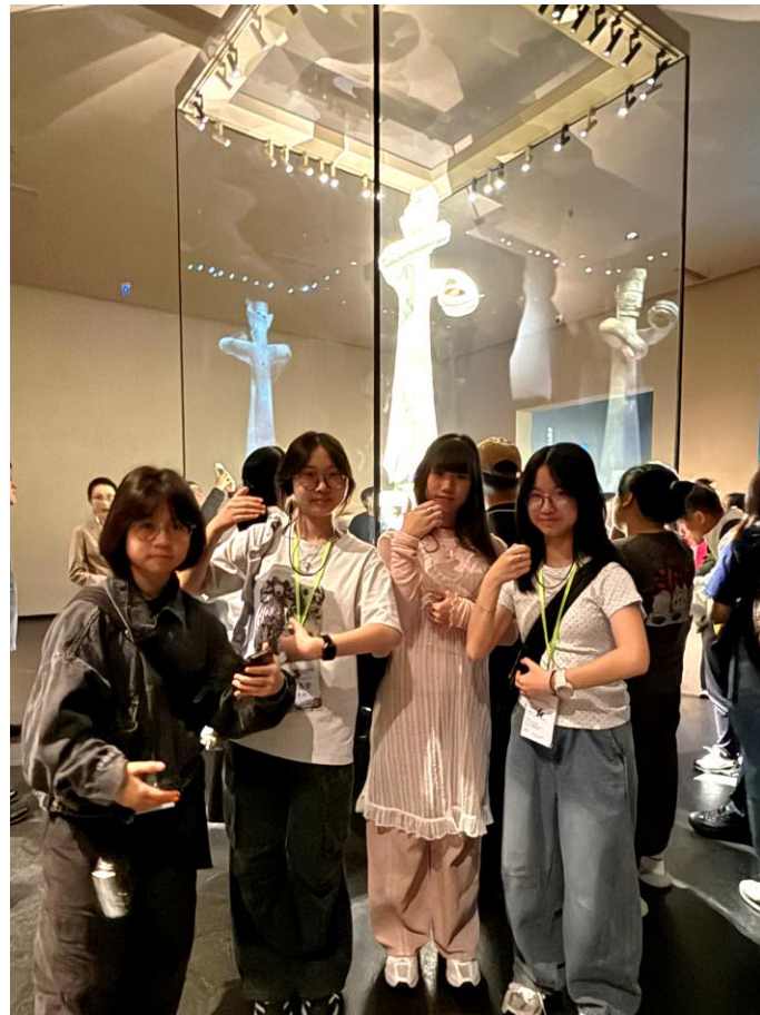
同學在三星堆博物館內參觀