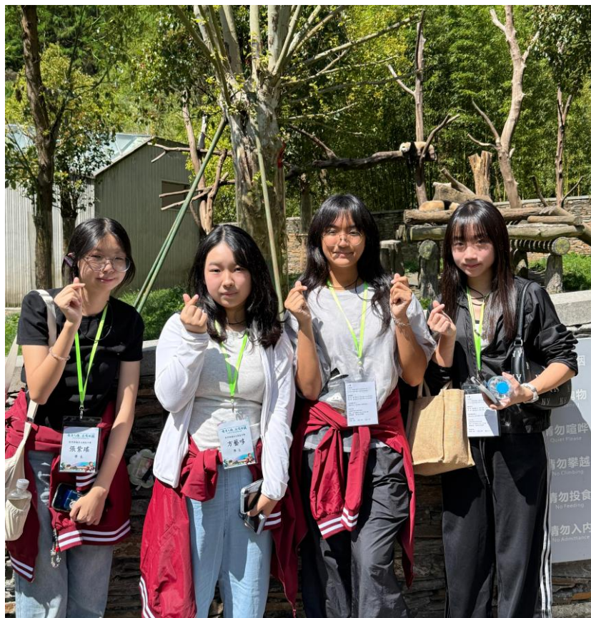
同學到臥龍中華大熊貓苑神樹坪基地參觀