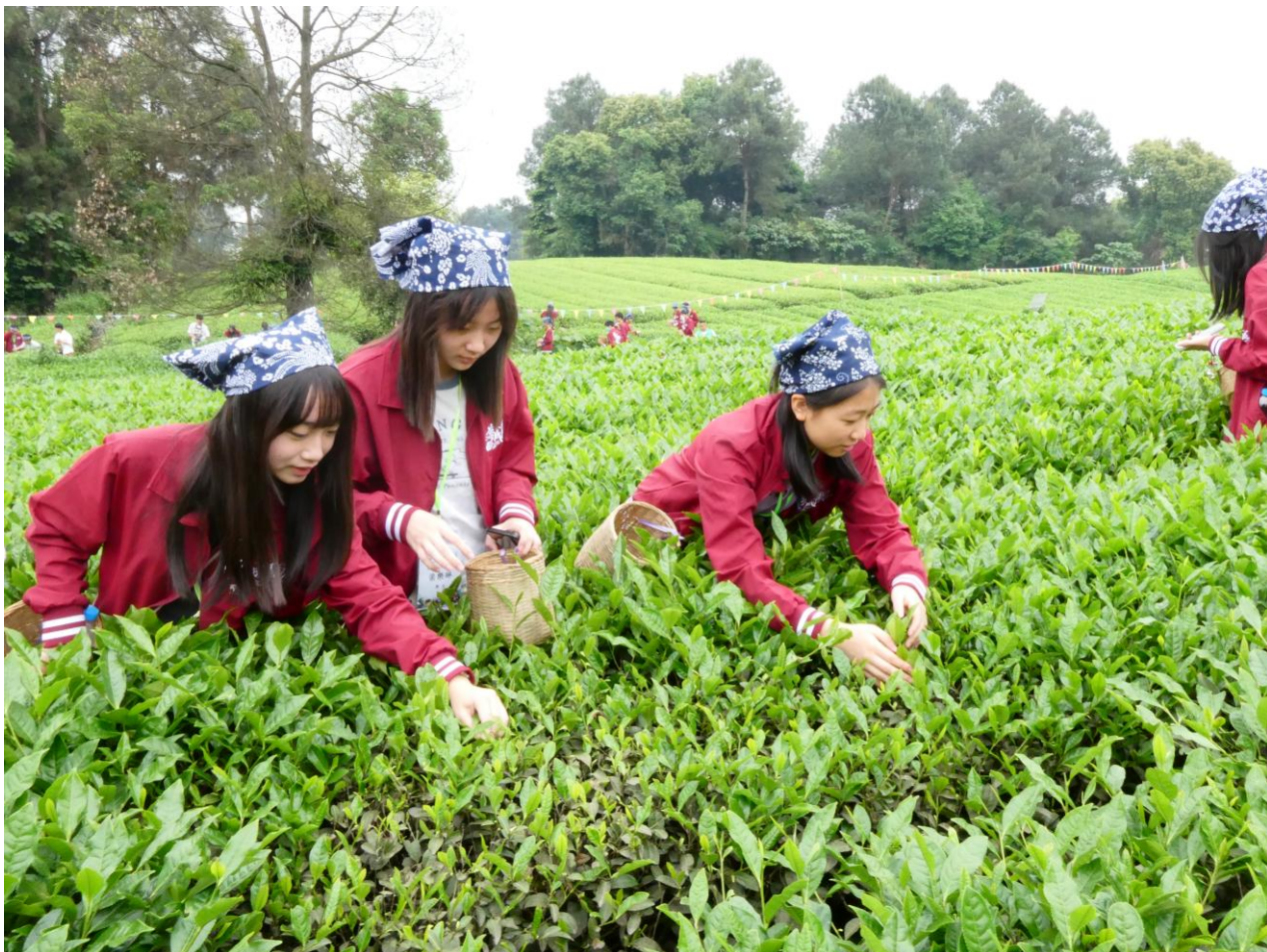
本校同學生全情投入採茶體驗活動