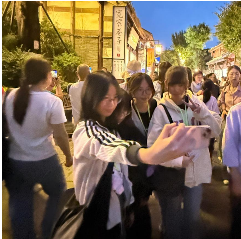
同學夜遊寬窄巷子