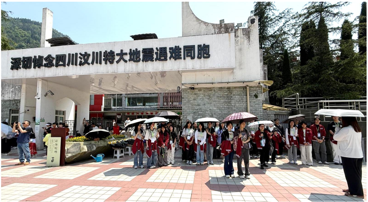
同學到 5·12 汶川特大地震紀念館參觀