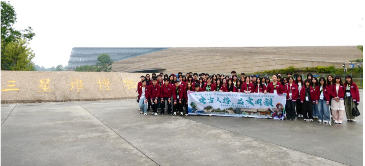
本校同學與所有參加者在三星堆博物館前合照