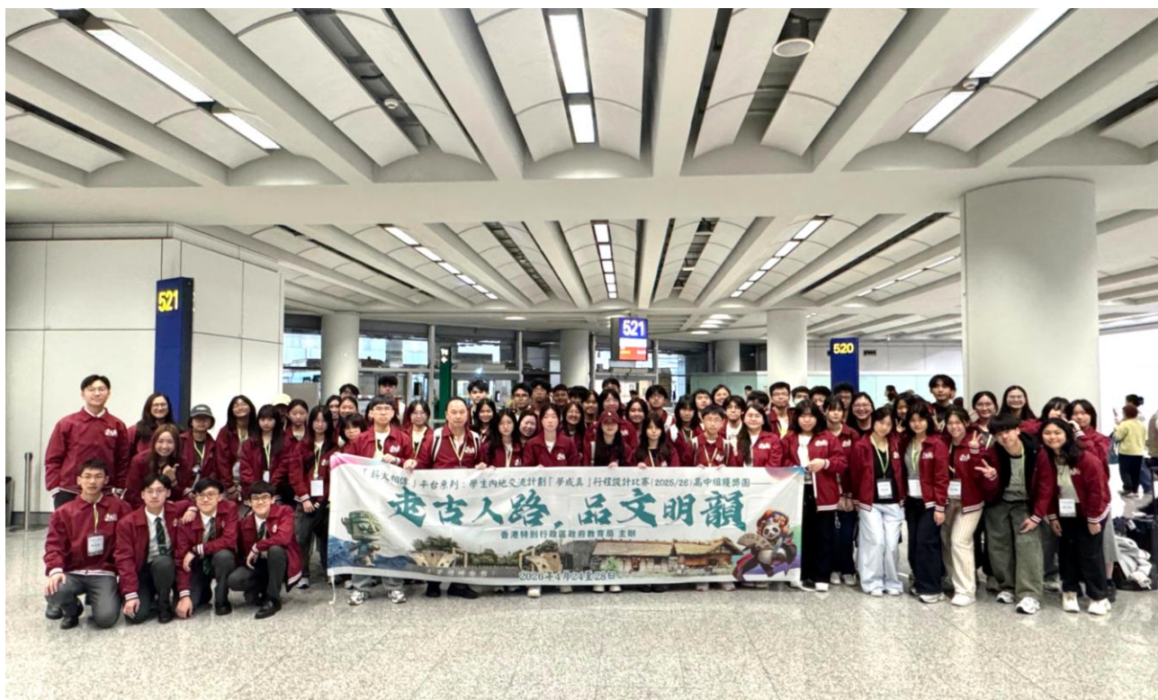
本校師生與所有參加者在香港國際機場合照

總括而言，這次考察活動擴闊同學視野，增加同學對中國歷史文化的認識和興趣，並提升他們的文化自信與國民身份認同。