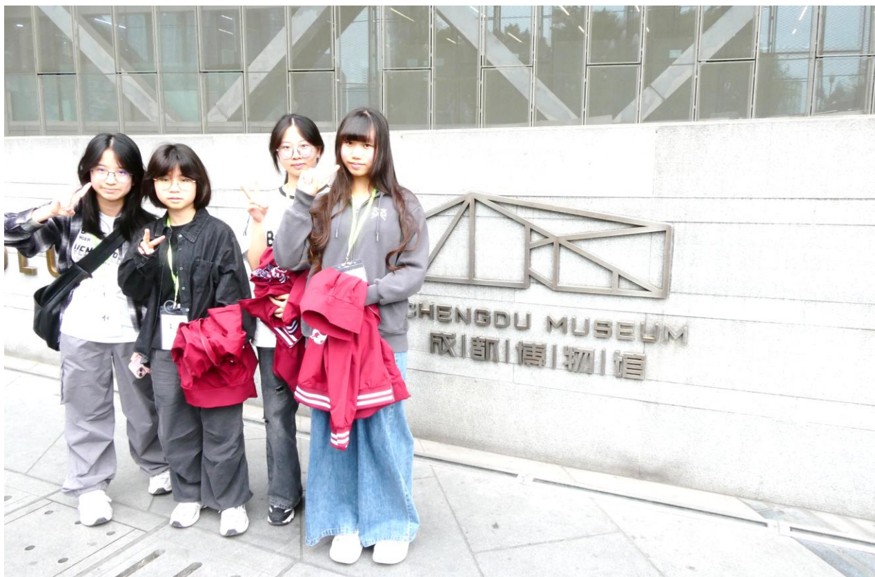
同學到成都博物館參觀