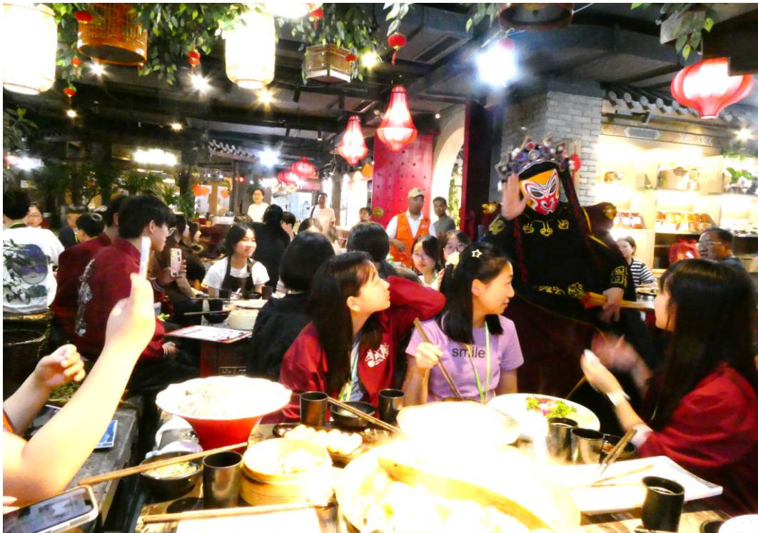
同學於晚膳時間觀看川劇「變臉」絕技