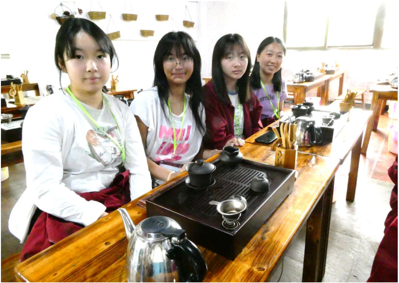
同學通過泡茶活動領悟傳統中華傳統文化